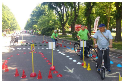
2016.június 12. Tour de Gyömrő