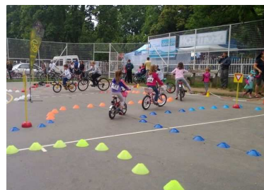
2016. szeptember 11. MSZSZ, Családi Mozcásfesztivál